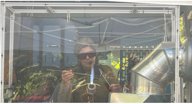
El arte cobra vida en Givens Aldersgate, cuando el vidrio fundido se transforma en impresionantes figuras durante una demostración en vivo de Magpie Glass.