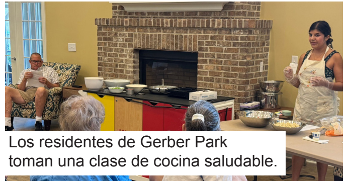
Los residentes de Gerber Park toman una clase de cocina saludable.

A lo largo de 2025, ocurrieron innumerables actos de bondad, compasión y generosidad dentro de Givens Communities y en la comunidad en general, superando con creces lo que podemos detallar aquí.