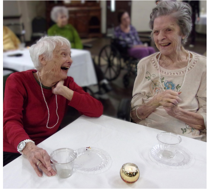
Una reunión social especial en Givens Highland Farms fue una Fiesta de Té por el Día de la Madre, compartida con nuestros residentes de Vida Independiente y del Centro de Atención Médica, junto con sus seres queridos.