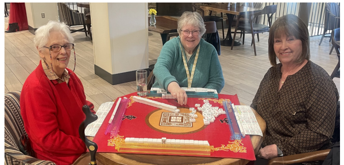
Un juego cada vez más popular que se disfruta en Givens Estates es el Mahjong, donde los jugadores combinan estrategia y habilidad, un poco de suerte y un animado grupo de participantes, quienes aseguran que siempre hay espacio para más.