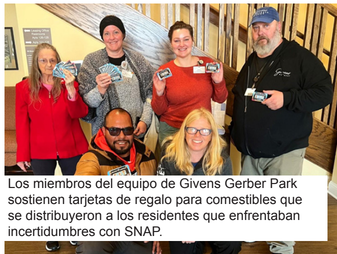
Los miembros del equipo de Givens Gerber Park sostienen tarjetas de regalo para comestibles que se distribuyeron a los residentes que enfrentaban incertidumbres con SNAP.

Recientemente, Givens Philanthropy brindó apoyo a los residentes de Givens Gerber Park (GGP) y Givens Great Laurels (GGL) que enfrentaban incertidumbre con sus beneficios del SNAP, el Programa de Asistencia Nutricional Suplementaria que ayuda a personas y familias de bajos ingresos a costear alimentos. Cuando estos beneficios se volvieron inciertos, muchos residentes experimentaron un estrés adicional para cubrir sus necesidades básicas.