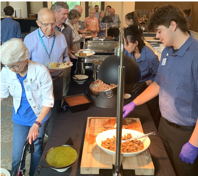
Con un gran agradecimiento al equipo de servicios de comedor, Givens Highland Farms atendió a 173 invitados en el Buffet del Día del Padre, una oportunidad para celebrar a los padres, las familias y los amigos con excelente comida y aún mejor compañía.