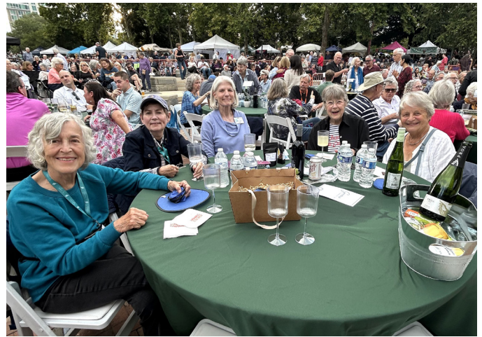
Los residentes y compañeros de Givens Communities disfrutaron de la Sinfónica de Asheville en el parque.